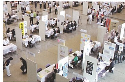
福祉の 職場説明会

福祉の仕事希望者と福祉の職場をつなぐ、無料職業紹介所です。就労あっせん、福祉の仕事の広報・啓発活動・職業体験研修、福祉事業従事者の資質向上研修をはじめ、保育士資格取得の修学資金貸付、潜在保育士再就職支援のための貸付など福祉人材の確保・定着のため幅広い活動に取り組んでいます。