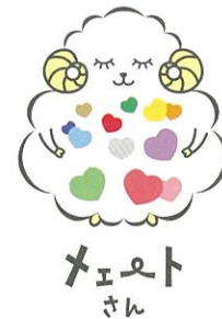
香川おもいやりネットワーク事業 キャラクター（公募作品）