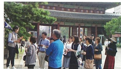
会員交流事業 (韓国旅行)

社会福祉施設や団体で働く方の福利厚生事業を行っています。香川県内の会員同士の親睦やリフレッシュを目的とした旅行、観劇、食事会など楽しいイベントの企画や地域で身近に利用できる優待割引サービスの実施など、福祉の職場を魅力あるものにするための取り組みを行っています。