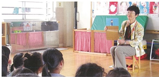
特技や経験を活かした地域活動 (保育所での読み聞かせ活動)

平成26年度から「高齢者いきいき案内所」を設置、コーディネーターを配置して、これまでの経験や特技を活かしたいと考えている方と活動の担い手を探している社会福祉施設・団体等を紹介・調整しています。